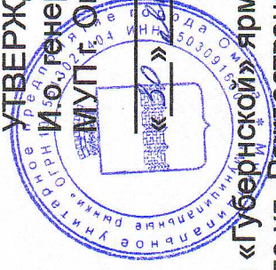
Схема расположения торговых мест на период проведения «Губернской» ярмарки МУП г. Омска «Муниципальные рынки» филиал «Ленински» по ул. Рождественского 6